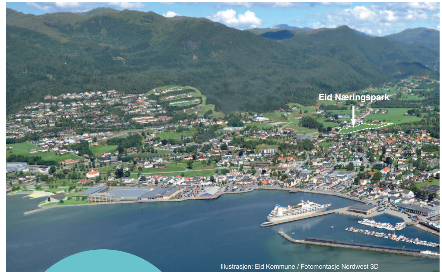
Illustrasjon: Eid Kommune / Fotomontasje Nordwest 3D

I næringsparkane er det plass til nye verksemdar som vil etablere seg i Eid, og til etablerte bedrifter som treng meir plass for å vekse.